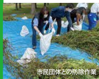
市民団体との防除作業

外来水生植物が用水路などから水田へ繁茂を広げており、農作物に影響を及ぼしています。水路の対策を地域全体で徹底的に行う総合的な防除体系を確立していく必要があります。