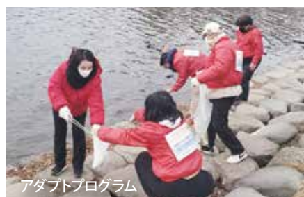
アダプトプログラム

次世代を担う学生の皆さんとともに手賀沼の現状を視察しています。次代の環境保全活動をリードする若手人材の育成を図る『 若者が主役の環境保全活動応援事業 』が令和5年度新規事業として創設されました!