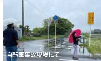
自転車事故現場にて