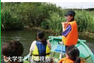
大学生と現場視察

次世代を担う学生の皆さんとともに手賀沼の現状を視察しています。次代の環境保全活動をリードする若手人材の育成を図る『 若者が主役の環境保全活動応援事業 』が令和5年度新規事業として創設されました!