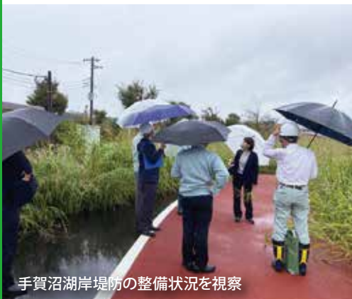
手賀沼湖岸堤防の整備状況を視察

平成25年に発生した台風26号は、手賀沼湖岸堤を越流し、若松地区の住宅や道路にて大きな浸水・冠水被害が発生したことに伴い、千葉県では手賀沼湖岸堤防の整備を進めています。長期間フェンスで覆われている状況等からも住民のご意見やご要望を踏まえ、議会で質疑し、事業の推進を要望してきました。住民のプライバシーの課題等から県の単独費用で遊歩道を整備することになり、令和5年度中に工事が完了し、供用開始となる予定です。防災の観点のみならず、手賀沼の景観を楽しむ空間構築に向け、進めています。