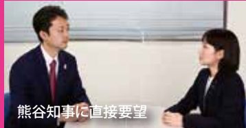
熊谷知事に直接要望