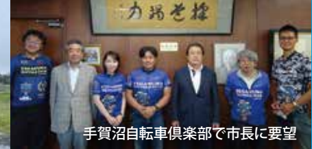
手賀沼自転車倶楽部で市長に要望

令和4年中における自転車関係する交通事故の発生件数は3,253件で、そのうち死傷者数15人、負傷者数3,172人でした。県民から危険箇所の情報収集を行いながら、歩行者、サイクリスト、ドライバーの視点で我孫子市に安全な自転車通行空間の整備に向けて政策協議を行っています。