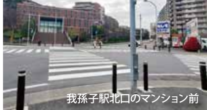
我孫子駅北口のマンション前

我孫子駅北口マンション前交差点の歩車分離式による交通安全対策として、子ども・高齢者・障がい者からのご要望により、県警と協議を行い、 歩行者信号機の時間延長とスクランブル化を実現 しました。