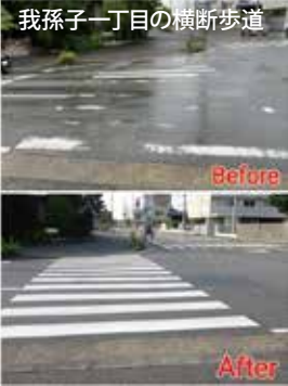
我孫子一丁目の横断歩道

我孫子第三小学校、第四小学校前、白山中学校前、久寺家一丁目横断歩道、我孫子北近隣センター並木本館前、青山台3丁目ダイヤ、柴崎台3丁目、あびこショッピングプラザ前など