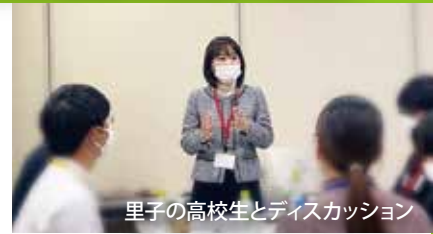
里子の高校生とディスカッション

●児童福祉司等の人材育成及び人材確保を推進するため、児童家庭課に「人材育成確保対策室」を新設